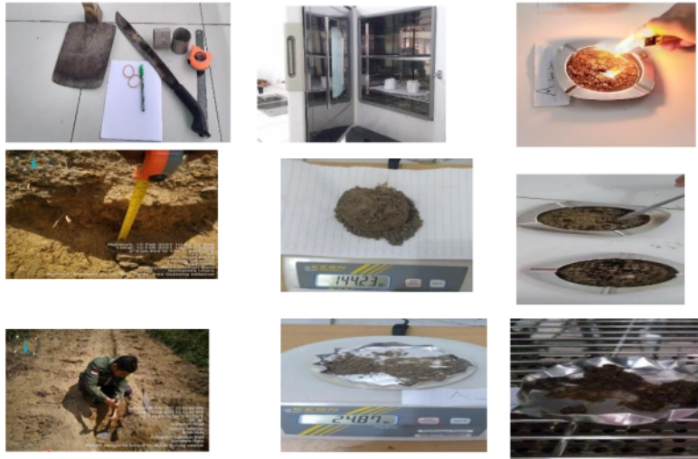
Gambar 2 Proses Analisis Fisika Tanah Di laboratorium